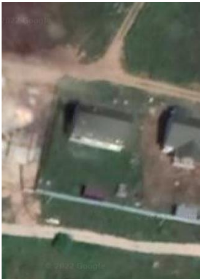
Рисунок 2 – Космоснимок рассматриваемой территории

Фотофиксация существующего состояния территории представлена на рисунке 3.