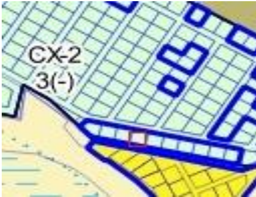
Рисунок 1 – Фрагмент карты градостроительного зонирования

- с севера: с проездом общего пользования— земельным участком с кадастровым номером 50:32:0010207:562; - с запада: с земельным участком с кадастровым номером 50:32:0010207:228; - с юга: с проездом общего пользования—земельным участком с кадастровым номером 50:32:0010207:552; - с востока: с земельным участком с кадастровым номером 50:32:0010207:230.