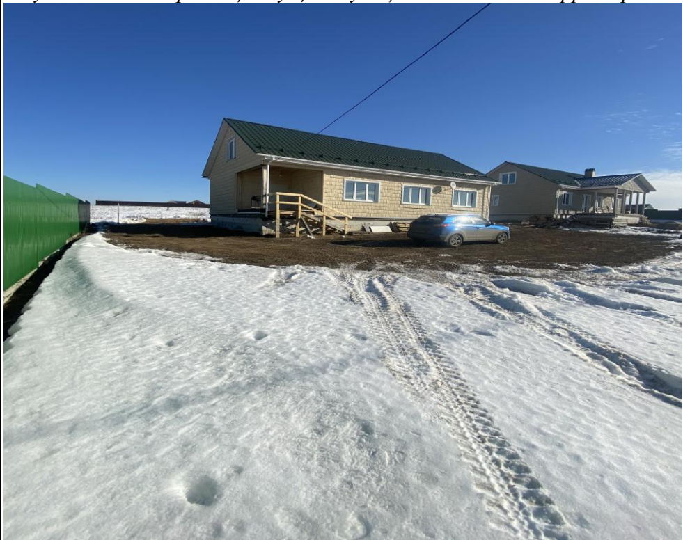
Рисунок 3 – Фотофиксация существующего состояния территории

Фотофиксация существующего состояния территории представлена на рисунке 3.